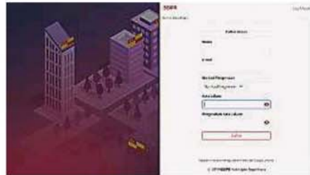
雪州水供用户即日起可登入雪州精明关爱人民计划系统网站，注册后申请免费水。

邓章钦指出，在州政府重新调整了免费水惠民政策后，有别于先前全民享有的方式，目前的申请者需符合附带条件，如个人或夫妻的家庭总收入需低于每月4000令吉，按照“一身分，一账户”的原