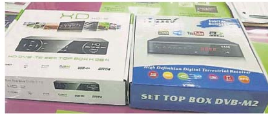
T2 BOX 是最普遍的解码器，货源短缺。

费者还需付出一笔安装费。另外，也有民众相信还有 B40 群体家庭对转换讯号毫不知情，甚至没收到解码器，或不知如何调整 IDTV 的解码器。