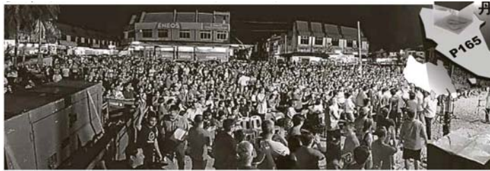
希盟在北干那那新市镇举行的大型政治讲座迎来近千人次的出席，而且气氛明显比之前热络。

Provided for client's internal research purposes only. May not be further copied, distributed, sold or published in any form without the prior consent of the copyright owner.