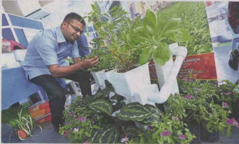
The Agrobbox is part of the Kebun Kita programme implemented in Taman Medan. It enables organic farming in urban areas by combining hydroponic and aquaculture techniques.

MBPJ's Kebun Kita programme supplies fresh produce to community and income for urban B40 group