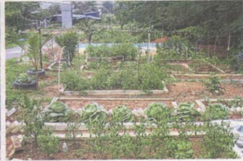
Kampung Selamat's urban farm sits on Syabas reserve land with permission from the water authority.