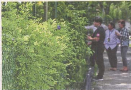
Yong repurposed leftover construction materials for SS24 Taman Megah Phase 2's urban farm, such as this chain-link fence.