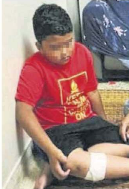
男童被恶犬咬伤后，疼痛感维持了半小时。