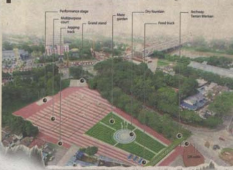
StarMetro 's front-page report on Nov 13.