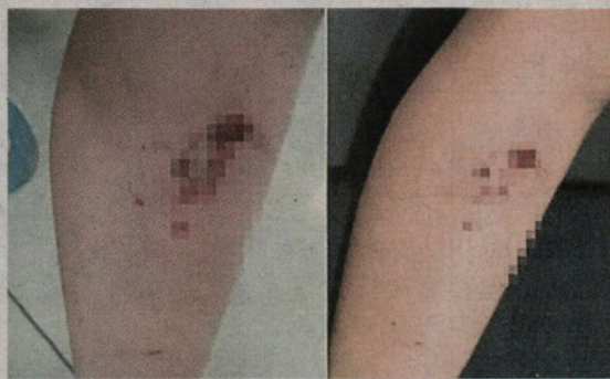
■沙益夫的小腿留下一吋半深的伤口。