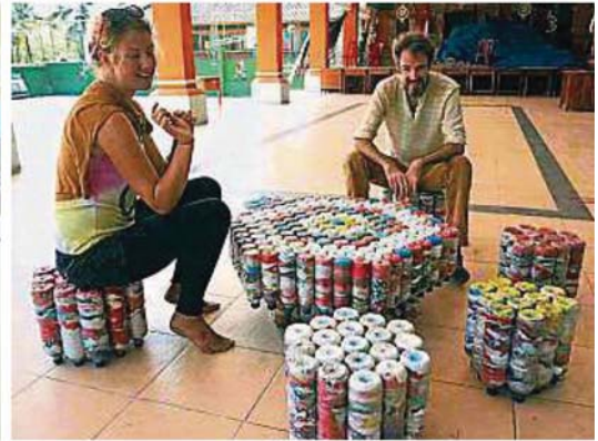
生態磚可被製成最夯的家俱，使垃圾獲得再生的機會。

（鵝唛14日訊）甲洞烏魯新村管委會追上潮流，于日前在该村民众会堂举行近日最夯的“生态砖”制作说明会，将被当做垃圾的塑料改造为各式各样设计新颖独特的另类家俱和装饰品，成功吸引约30人报名。