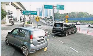
黑色车辆车主不顾安危，违例从蒲種工业区转至蒲種公主城高架天橋，险象环生。

“欲从蒲種工业区转至蒲種公主城的车辆暂时只能使用蒲種特易购霸级市场的U转高架天橋前往目的地。”