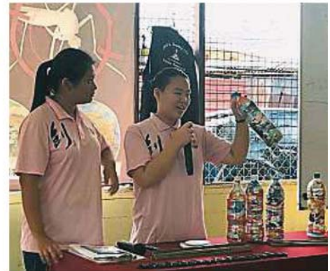
士拉央峇鲁达鲁宜山国中的学生到新村为出席者讲解“生态砖”的制作方法。