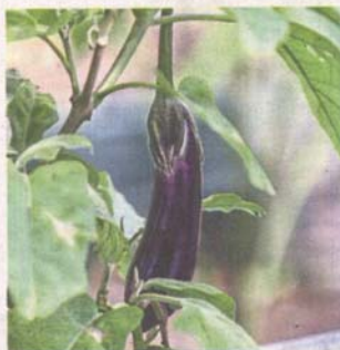
SS24 Taman Megah Phase 2's urban farm is mostly filled with herbs and vegetables.