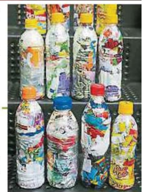
五彩缤纷的塑料瓶，在组合起来便可成为家中实用的配件。