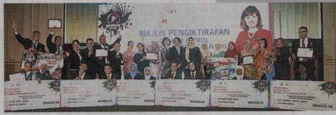
▲防範骨痛熱症巡邏隊比賽參賽的學校逐年增加，今年參賽的學校更是增至131所，反應熱烈。

另外，视频中也记录了与当地媒体与企业展开具有影响力的互动、与非政府组织合作进行推行项目，其中包括大扫除互动合作活动和社区性活动，例如市场访视以及参加预防骨痛热症巡邏隊，藉此提高人们的认知程度，同时也收集骨痛热症受害者的历史感言。