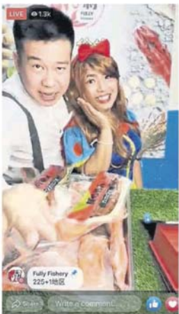
李嘉诚风格幽默，还不时“角色扮演”，常引来许多网友追捧。

“李嘉诚为了让网友有新鲜感，还不时‘角色扮演’，包括装扮成蜘蛛侠、复古装、古怪装等，有时还会找人客串，例如《新喜剧之王》上映时，我们也扮演戏中角色，与网友打成一片。”