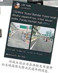
环城大道公司在推特发布蒲種公主城高架天橋正式通车的消息。

全措施及观察重型罗里的管制。“我们必须顾虑到从蒲種工业区至蒲種公主城民众的方便及该工业区有许多重型罗里带来的危险。”